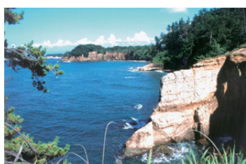
Echizen Kaga Coast Quasi-National Park (9,794ha) (越前加賀海岸国立公園)