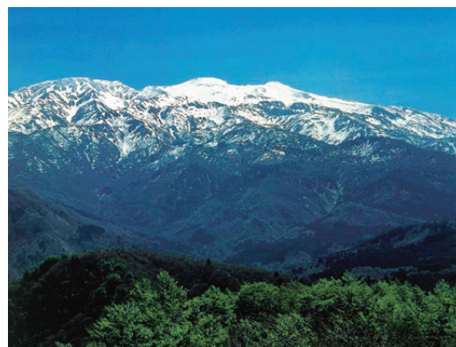
Haku-san National Park (49,900ha) (白山国立公園)