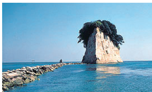
Noto Peninsula Quasi-National Park (9,672ha) (能登半島国立公園)