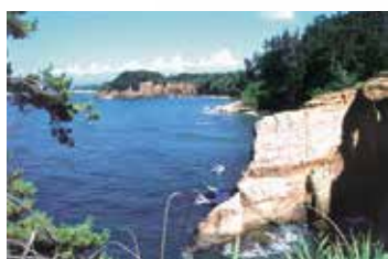
Echizen Kaga Coast Quasi-National Park (9,794ha) (越前加賀海岸国立公園)