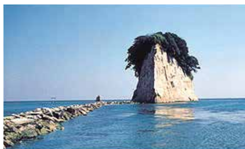
Noto Peninsula Quasi-National Park (9,672ha) (能登半島国立公園)