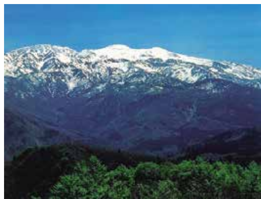
Haku-san National Park (49,900ha) (白山国立公園)