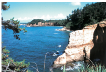
Echizen Kaga Coast Quasi-National Park (9,794ha) (越前加賀海岸国立公園)