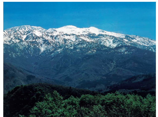
Haku-san National Park (49,900ha) (白山国立公園)