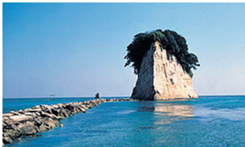
Noto Peninsula Quasi-National Park (9,672ha) (能登半島国立公園)