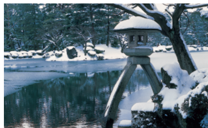
兼六園（兼六園）