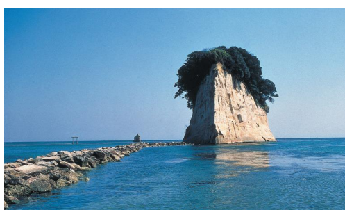
Noto Peninsula Quasi-National Park (9,672ha) (能登半島国立公園)