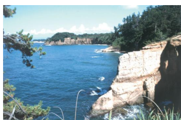
Echizen Kaga Coast Quasi-National Park (9,794ha) (越前加賀海岸国立公園)