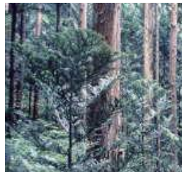
Prefectural Tree (Ate) 県木 (アテ)

県内には30～40羽が住んでいると推定されますが、全国的に見ても300羽ぐらいいしかないことから、非常に貴重です。