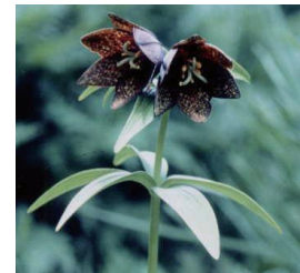
Local Flower (Chocolate Lilly) 郷土の花 (クロユリ)

緑の環境づくりと愛樹思想の啓発を目的に県民から公募し、指定されました。能登地方に多く生息し、本県独特の造林樹種で家具、建築材や輪島漆器の木地にも多く使われています。「アテ」の名はヒノキアスナロの北陸での地方名です。