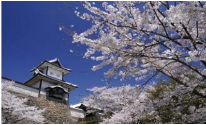
金泽城 (金沢城)