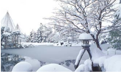
兼六園 (兼六園)