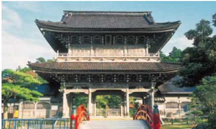
总持寺祖院 (總持寺祖院)

本県には、豊かな自然や伝統文化など、魅力ある観光資源が数多くあり、2018年には2,491万5千人の観光客が訪れています。 能登半島は外浦の豪快な奇勝と内浦の波静かな入り江が対照的な海岸美を見せており、中能登には、七尾湾に臨む和倉温泉があり、年間81万人の温泉客が能登の人情と味を楽しんでいます。 県都金沢市は、城下町の面影を今に残し、市の中央には、日本三名園の一つ兼六園や金沢城、武家屋敷などがあり、加賀友禅等の伝統工芸もみることができます。また、金沢は泉鏡花、徳田秋声、室生犀星など優れた日本近代文学者を輩出しています。 南加賀地方には日本三名山の一つ白山を中心とした白山国立公園があり、広大な樹海と高山植物の群落を誇っています。山麓には、豊富な湯量の温泉や雄大な展望を楽しめる白山白川郷ホワイトロードがあります。 山中、山代、片山津、粟津からなる加賀温泉郷は和倉温泉とともに全国有数の温泉地として快適な宿泊施設とゆきとどいたサービスで、年間188万人の温泉客をもてなしています。温泉地の周辺には、越前加賀海岸国定公園、那谷寺、ゴルフ場等があり、九谷焼、山中漆器などの伝統産業と一体となった一大観光地を形成しています。