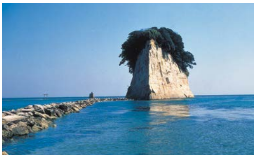
能登半島国定公園 (9,672ha) (能登半島国定公園)