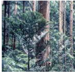
Prefectural Tree (Ate) 県木 (アテ)

県内には30～40羽が住んでいると推定されますが、全国的に見ても300羽ぐらいいしかないことから、非常に貴重です。