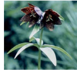
Local Flower (Chocolate Lilly) 郷土の花 (クロユリ)

緑の環境づくりと愛樹思想の啓発を目的に県民から公募し、指定されました。能登地方に多く生息し、県独特の造林樹種で家具、建築材や輪島漆器の木地にも多く使われています。「アテ」の名はヒノキアスナロの北陸での地方名です。