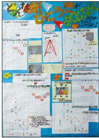
金沢大学附属小学校 2年