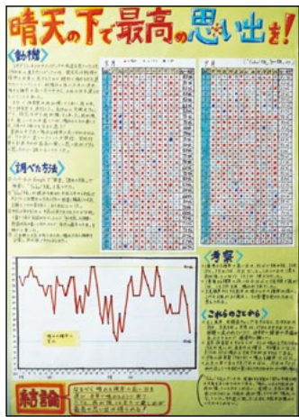
能登町立小木中学校 2年