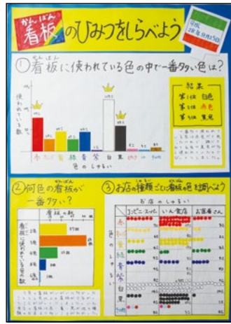
金沢市立浅野川小学校 3年