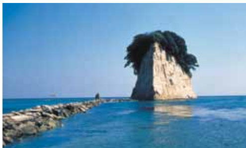
Noto Peninsula Quasi-National Park (9,672ha) (能登半島国立公園)