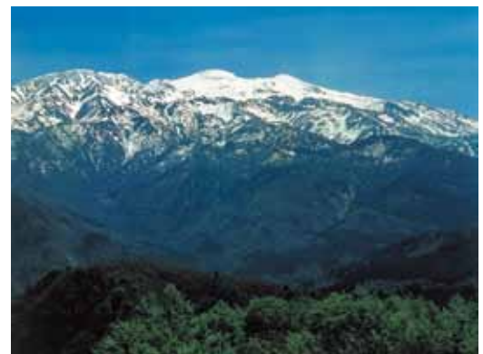
Haku-san National Park (47,700ha) (白山国立公園)