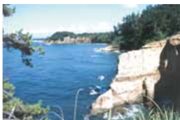
Echizen Kaga Coast Quasi-National Park (9,246ha) (越前加賀海岸国立公園)