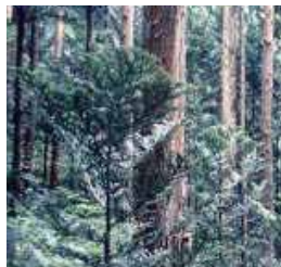
Prefectural Tree (Ate) 県木 (アテ)

県内には30～40羽が住んでいると推定されますが、全国的に見ても300羽ぐらいいしかないことから、非常に貴重です。