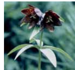
Local Flower (Black Lilly) 郷土の花 (クロユリ)

緑の環境づくりと愛樹思想の啓発を目的に県民から公募し、指定されました。能登地方に多く生息し、本県独特の造林樹種で家具、建築材や輪島漆器の木材にも多く使われています。「アテ」の名はヒノキアスナロの北陸での地方名です。