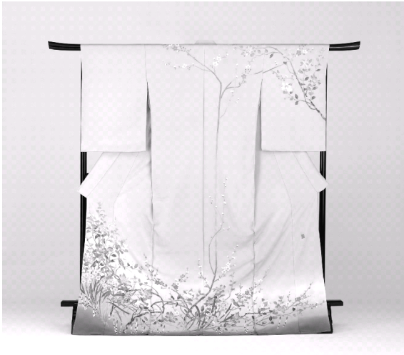
加賀友禅きもの（訪問着）