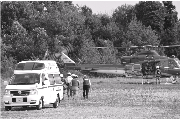
平成 23年度石川県防災総合訓練