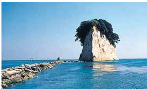
Noto Peninsula Quasi-National Park (9,672ha) (能登半島国立公園)