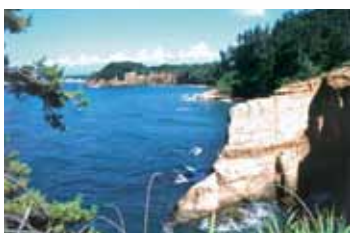
Echizen Kaga Coast Quasi-National Park (9,794ha) (越前加賀海岸国立公園)