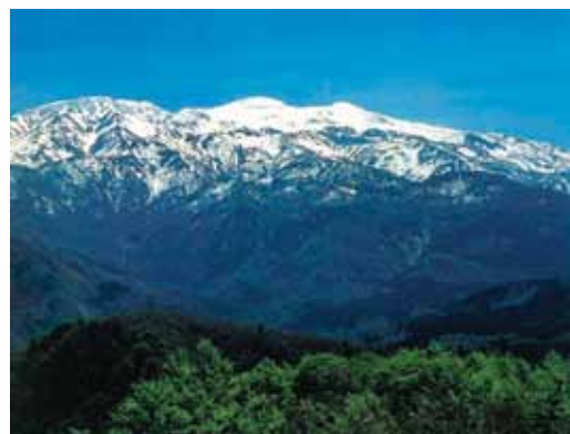
Haku-san National Park (49,900ha) (白山国立公園)