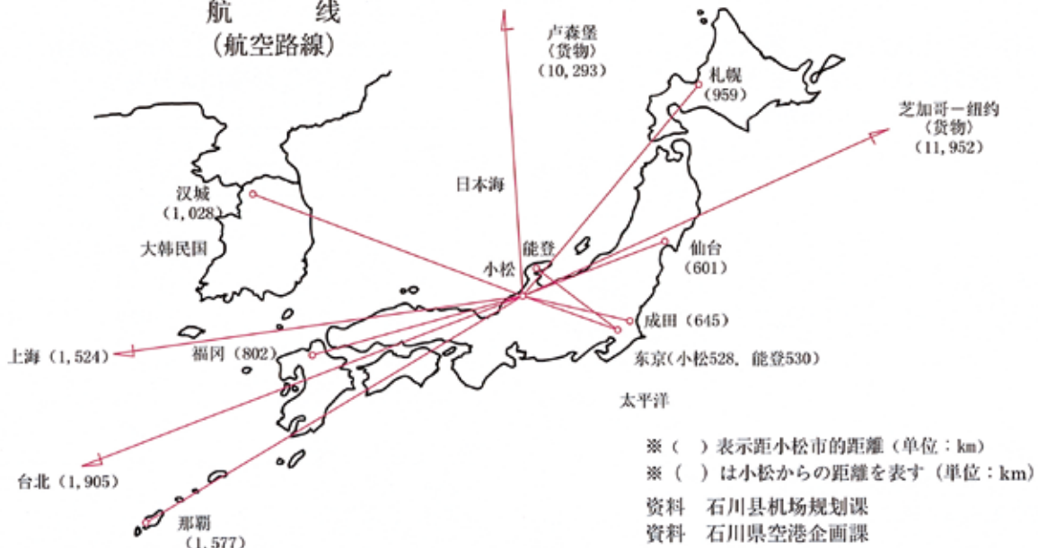
航 线 (航空路線)

資料 石川県机场规划課、新幹線・交通対策監室 資料 石川県空港企画課、新幹線・交通対策監室