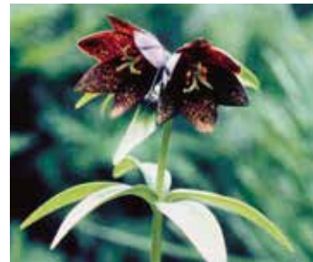
郷土の花 (クロユリ)

緑の環境づくりと愛樹思想の啓発を目的に県民から公募し、指定されました。能登地方に多く生息し、本県独特の造林樹種で家具、建築材や輪島漆器の木地にも多く使われています。「アテ」の名はヒノキアスナロの北陸での地方名です。