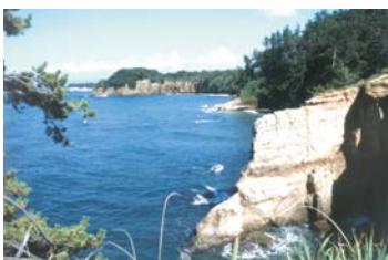
Echizen Kaga Coast Quasi-National Park (9,794ha) (越前加賀海岸国立公園)