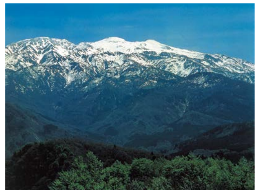
Haku-san National Park (49,900ha) (白山国立公園)