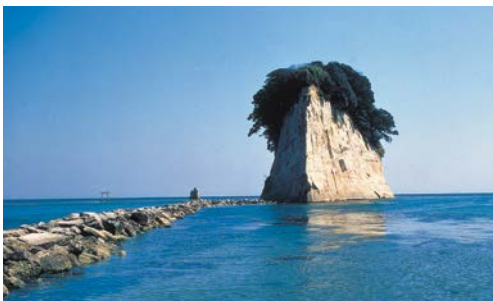
Noto Peninsula Quasi-National Park (9,672ha) (能登半島国立公園)