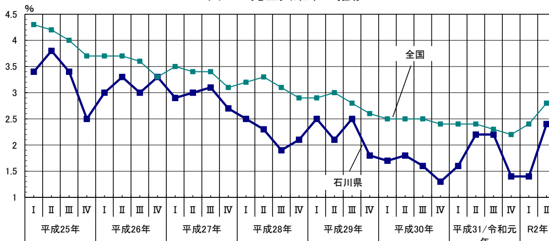
図1 完全失業率の推移