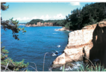
Echizen Kaga Coast Quasi-National Park (9,794ha) (越前加賀海岸国立公園)