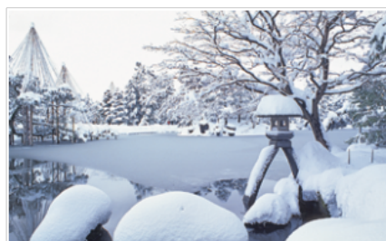
兼六園（兼六園）