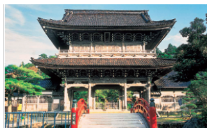
总持寺祖院（總持寺祖院）

山中、山代、片山津、粟津からなる加賀温泉郷是和倉温泉とともに全国有数の温泉地として快適な宿泊施設とゆきとどいたサービスで、年間182万人の温泉客をもてなしています。温泉地の周辺には、越前加賀海岸国定公園、那谷寺、ゴルフ場等があり、九谷焼、山中漆器などの伝統産業と一体となった一大観光地を形成しています。