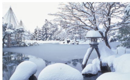
兼六園（兼六園）