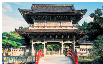
总持寺祖院（總持寺祖院）

山中、山代、片山津、栗津からなる加賀温泉郷は和倉温泉とともに全国有数の温泉地として快適な宿泊施設とゆきとどいたサービスで、年間69万人の温泉客をもてなしています。温泉地の周辺には、越前加賀海岸国定公園、那谷寺、ゴルフ場等があり、九谷焼、山中漆器などの伝統産業と一体となった一大観光地を形成しています。