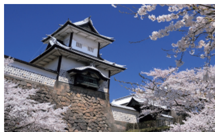
金泽城（金沢城）