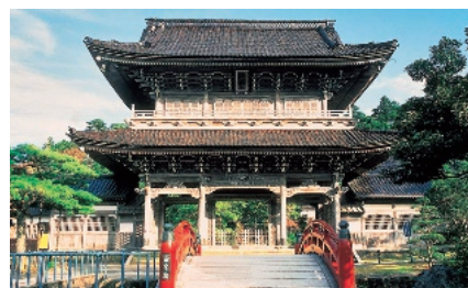
总持寺祖院（總持寺祖院）

山中、山代、片山津、栗津からなる加賀温泉郷は和倉温泉とともに全国有数の温泉地として快適な宿泊施設とゆきとどいたサービスで、年間105万人の温泉客をもてなしています。温泉地の周辺には、越前加賀海岸国定公園、那谷寺、ゴルフ場等があり、九谷焼、山中漆器などの伝統産業と一体となった一大観光地を形成しています。