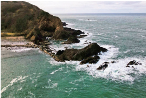
Noto Peninsula Quasi-National Park (9,672ha) (能登半島国立公園)