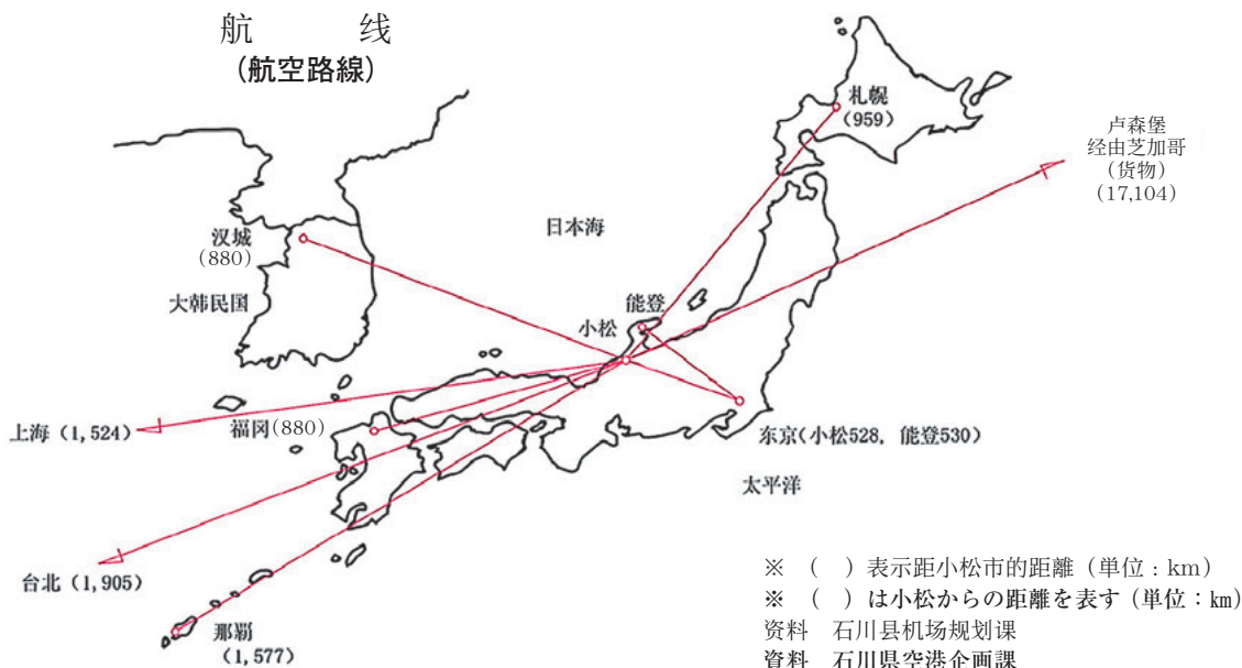
航 线 (航空路線)

※ ( ) 表示距小松市の距離 (単位: km) ※ ( ) は小松からの距離を表す (単位: km)