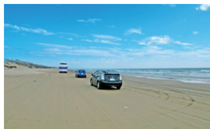
千里濱渚海濱公路 (千里浜なぎさドライブウェイ)

山中、山代、片山津、栗津からなる加賀温泉郷は和倉温泉とともに全国有数の温泉地として快適な宿泊施設とゆきとどいたサービスで、年間124万人の温泉客をもてなしています。温泉地の周辺には、越前加賀海岸国定公園、那谷寺、ゴルフ場等があり、九谷焼、山中漆器などの伝統産業と一体となった一大観光地を形成しています。